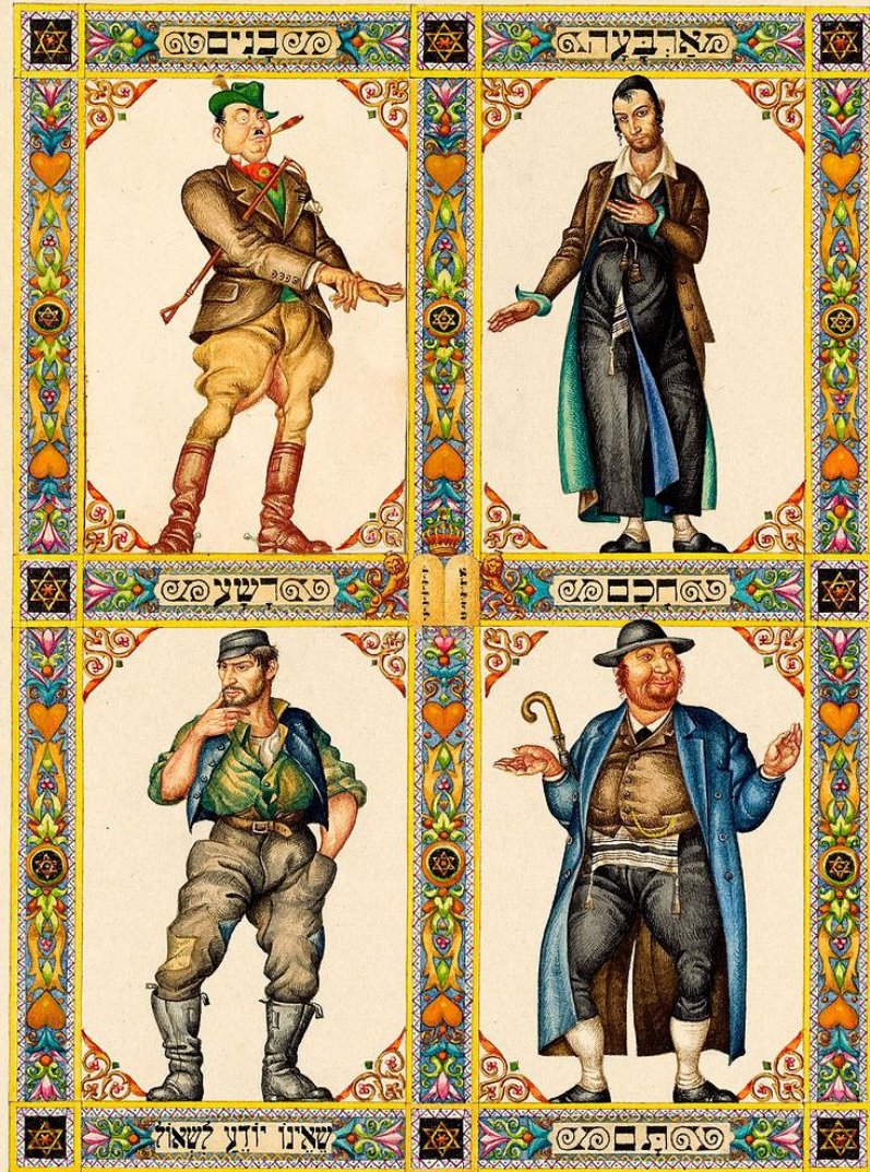
אמור, יצחק, 1951

פגש חכם בחכמה אהב התם את התמימה והרשע בתור אישה תפס מרשעת איומה והרשע בתור אישה תפס מרשעת איומה וזה שלא ידע לשאול לקח את היפה מכל שילב ידו בתוך ידה וחזר איתה להגדה שילב ידו בתוך ידה וחזר איתה להגדה לאן הובילו הדרכים? היכן ארבעת האחים? בשיר שלנו יידי אסור לשאול יותר מדי בשיר שלנו יידי אסור לשאול יותר מדי.